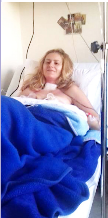
άντληση μετά το χειρουργείο

Ο θηλασμός δεν υπήρξε βάρος αυτήν την περίοδο. Δεν ήταν κάτι που έκανα παρά τον καρκίνο. Ήταν αυτό που με βοηθούσε να τον αντιμετωπίσω. Χάρηκα που δεν απαιτούνταν διακοπή του θηλασμού λόγω της ασθένειάς μου.